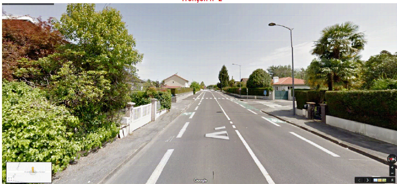
Bandes cyclables de l'avenue Beau Soleil