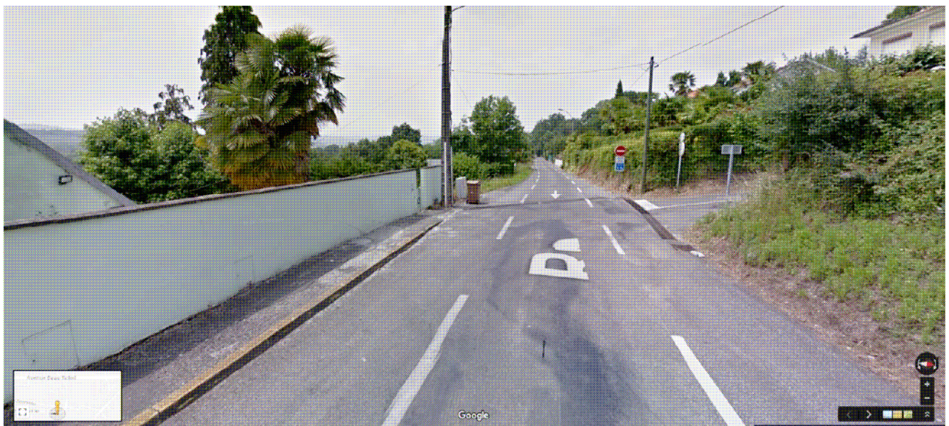
Tronçon n° 1 à proximité de l'intersection avec l'avenue Sorrento