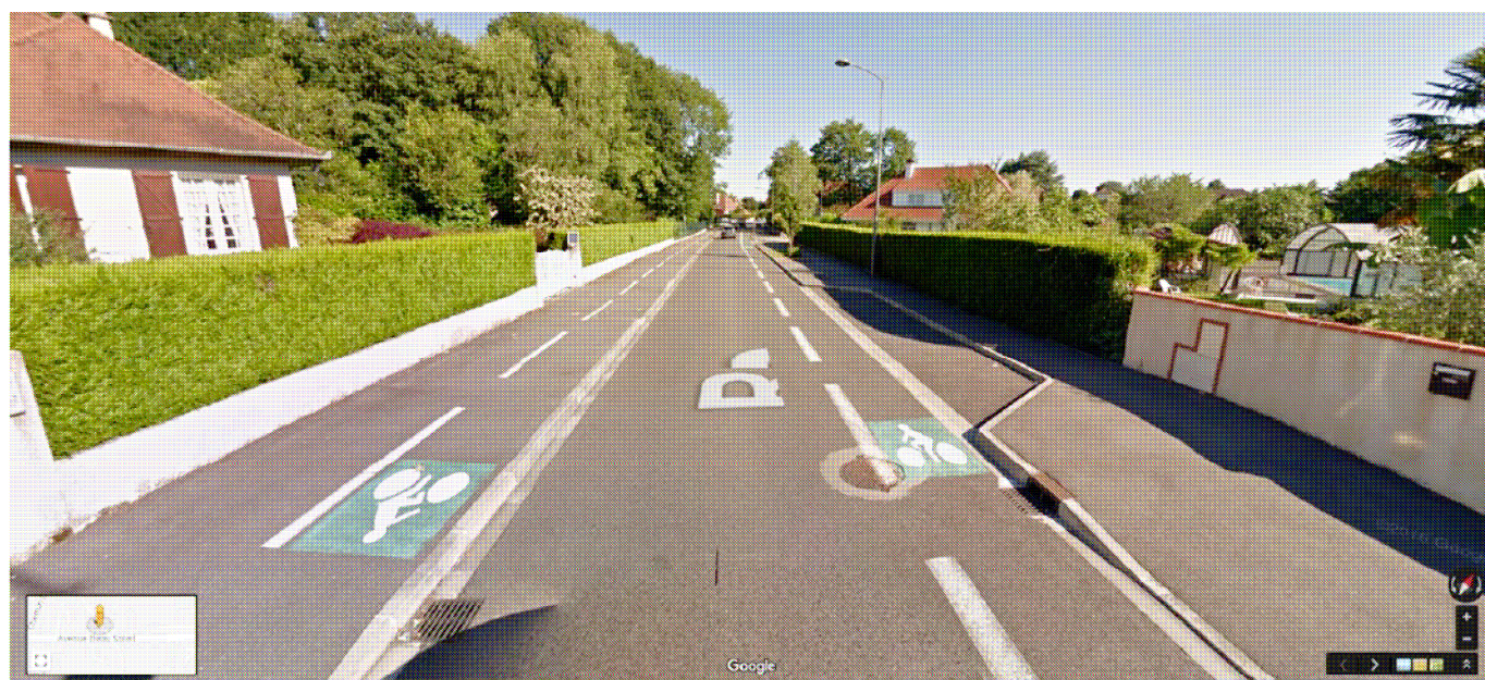
Tronçon n° 2