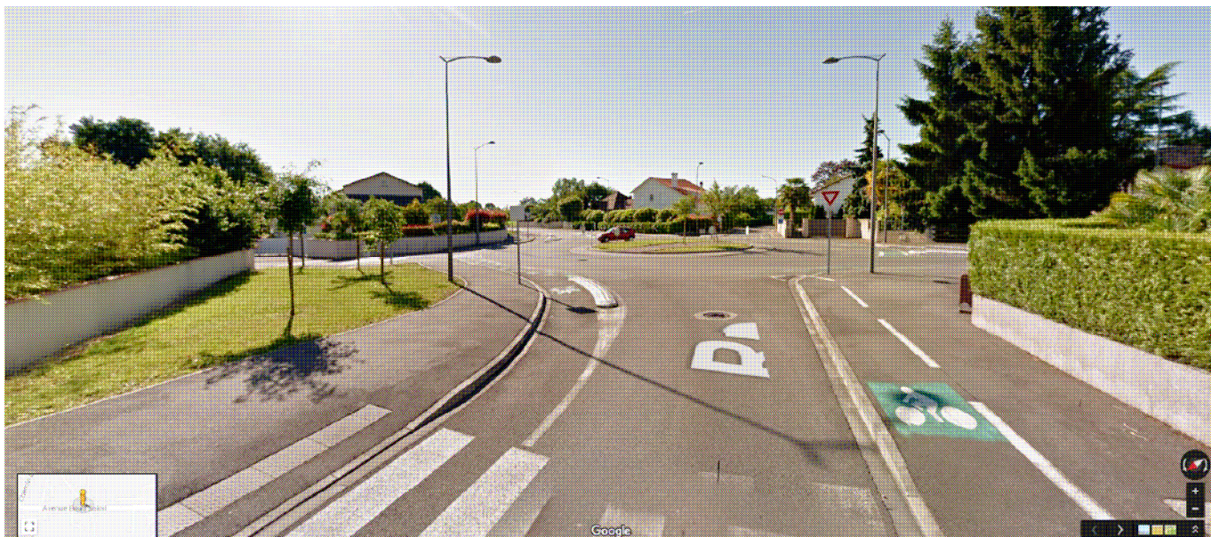
Amorce tronçon n° 2 après le giratoire Cousté/Beau Soleil