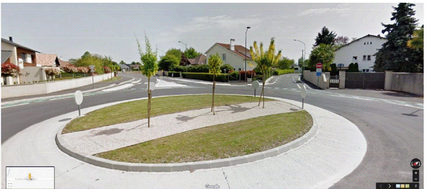
Giratoire Cousté/Beau Soleil