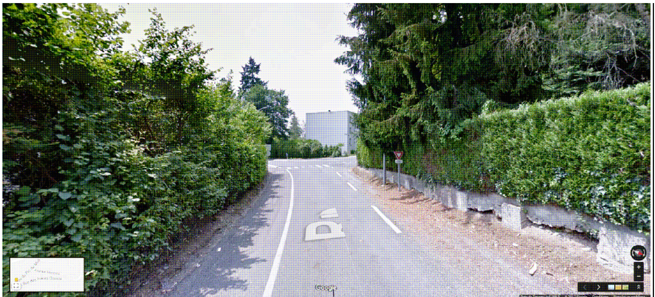
Tronçon n° 1 à proximité de l'intersection avenue de la République