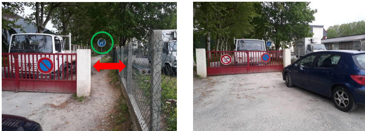
Figure 1 - Portail donnant accès à la base de plein air de Gelos

A la jonction entre Gelos et Pau , nous attendons avec impatience l'ouverture du nouveau franchissement du Soust dans le quartier de la Tannerie, qui permettra d'éviter le détour par la D235 et son trafic automobile. A ce sujet, il eut été pertinent que la Communauté d'Agglomération supprime ou mette à jour le panneau d'information installé au 6 rue du Soust. Celui qui figure actuellement sur place ne fait que mettre en exergue les mois de retard pris sur ce chantier (voir Figure 2).