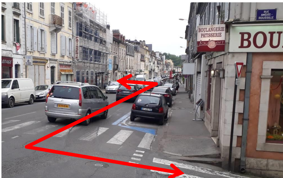
Figure 3 - Intersection V81 / rue du XIV juillet

Sur la commune de Pau , nous osons espérer que l'intersection avec la rue du XIV juillet ne restera pas en l'état. Actuellement, pour relier la rue du Soust et la rue Amédée Roussille, les usagers de la véloroute sont confrontés à 60 mètres de circulation à haut risque sur la rue du XIV juillet empruntée par plusieurs milliers de véhicules par jour. Comme préconisé par le cahier des charges du SN3V, le strict minimum et seulement à titre provisoire , est d'aménager des bandes cyclables pour assurer la continuité de l'itinéraire, ce qui n'est pas le cas aujourd'hui. L'option d'une passerelle suspendue en surplomb du gave a-t-elle définitivement été écartée ? Si oui, l'aménagement d'une piste sécurisée s'avère nécessaire, au moins sur cette portion, si ce n'est sur l'ensemble de la rue du XIV juillet, ce qui assurerait une continuité cyclable avec les aménagements déjà réalisés avenue Henri IV à Jurançon. Cet axe XIV juillet/Marca étant cité dans le baromètre de la FUB comme un des principaux points noirs de la ville, nous désirons aborder ultérieurement et de manière exhaustive ce sujet avec la Direction des Mobilités.