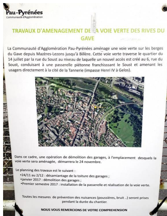
Figure 2 - Panneau Rue du Soust

Par ailleurs, la rue du Soust est actuellement un haut lieu de transit pour les automobilistes qui veulent éviter le feu au débouché de la rue de Gelos. Dans ce double-sens cyclable, la largeur de voie très limitée ne permet pas d'ors-et-déjà de croiser un véhicule sereinement. A l'avenir, cet important trafic automobile fera un très mauvais accueil à ce point d'entrée des cyclotouristes dans la ville de Pau. La seule option permettant de rendre cette axe conforme à un passage en véloroute et de sécuriser les usagers du quotidien est de la convertir en sens interdit sauf riverains et vélos.