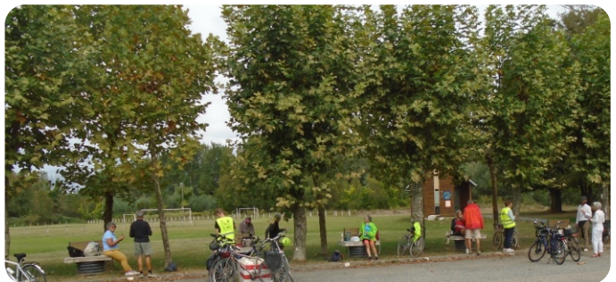
2 février, 5 juillet, 2 août, 6 septembre, 18 octobre