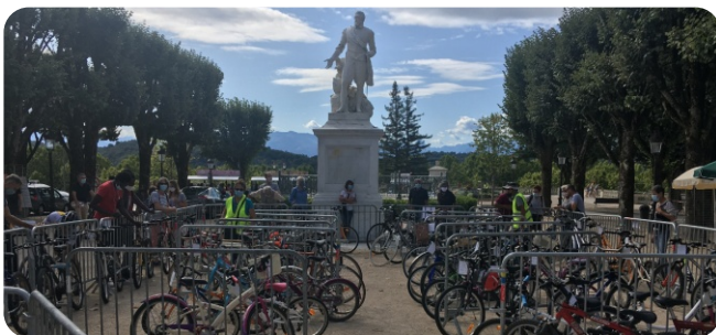
20 septembre 2020, un grand succès !